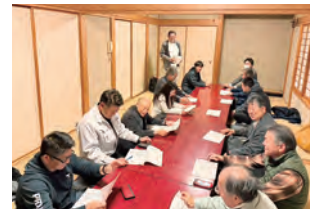
長浦・昭和・平川支部