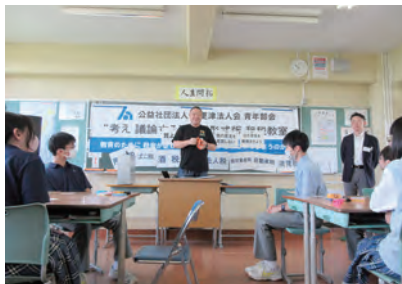
私立志学館中等部