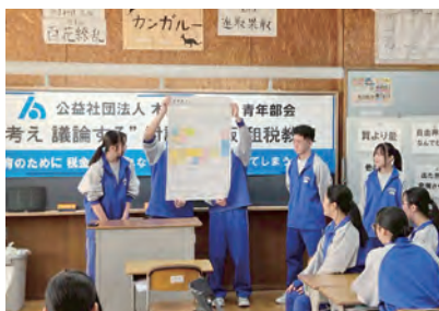
富津市立富津中学校