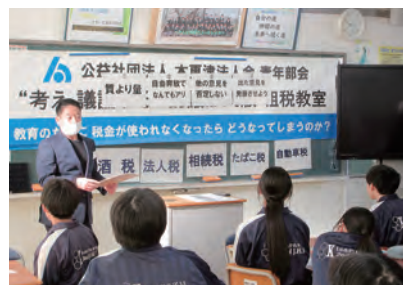
木更津市立木更津第二中学校