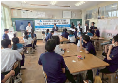
袖ヶ浦市立平川中学校