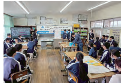
君津市立君津中学校