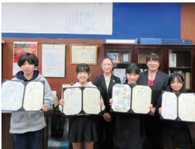
君津市立八重原小学校