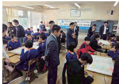
君津市立周西南中学校