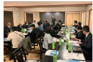
富津・大佐和・天羽支部