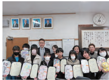
木更津市立祇園小学校