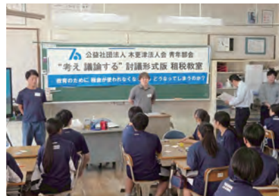
君津市立八重原中学校