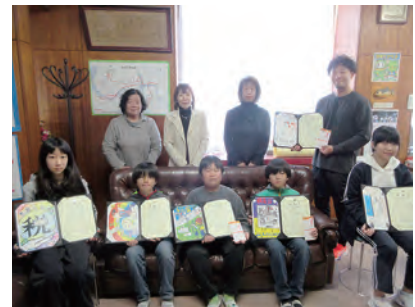
富津市立天羽小学校