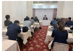
富来田・木更津西・木更津南・請西鎌足支部