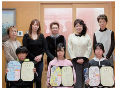
木更津市立中郷小学校