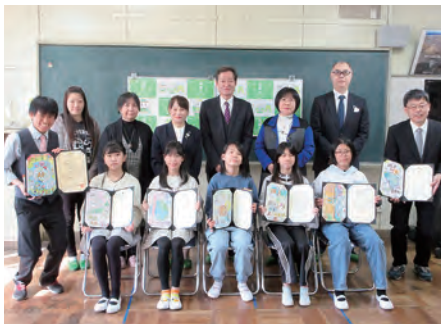
木更津市立高柳小学校