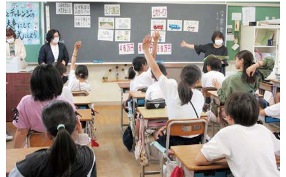
女性部会 小学校高学年向け租税教室