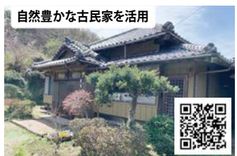
自然豊かな古民家を活用