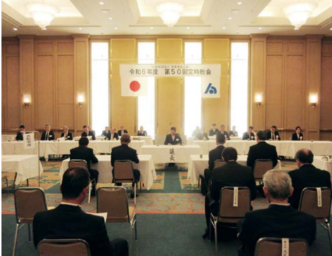
第50回定時総会開催

発行所/公益社団法人木更津法人会 〒292-0838 木更津市潮浜1丁目17番59号 TEL.0438-37-7720 FAX.0438-37-7740 発行人/加藤智生・編集/広報委員会・印刷所/有限会社アドメイクス http://www.kisarazu-houjinkai.or.jp