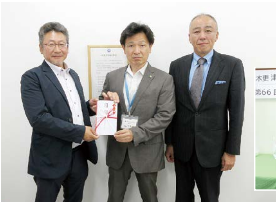
第66回会員親睦チャリティゴルフ大会 日本赤十字社千葉県支部木更津地区に寄付