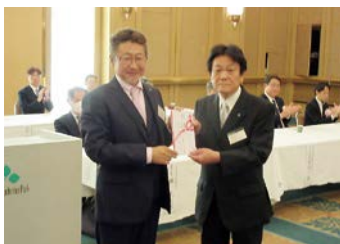
ポイントレース表彰 1 位 木更津東支部

租税教室、絵はがきコンクール、各種セミナー等の継続事業等の活動報告がされました。また、4 年ぶりの実施となった会員親睦