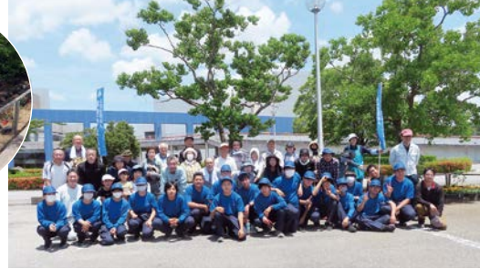
君津地区 君津市民文化ホール