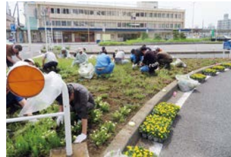
木更津地区 木更津西口(みなと口)駅前ロータリー