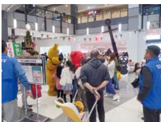
令和5年度 やさしい税金クイズ大会