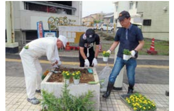
木更津中央支部 富士見通り