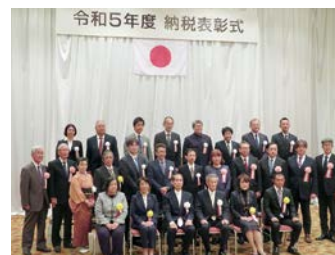
令和5年度 納税表彰式